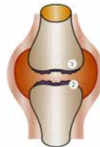
Krankes Gelenk: 1 Verhärtung der Knochenoberfläche 2 Knorpelzerstörung

Arthrose ist eine degenerative, also stetig fortschreitende, Gelenkerkrankung, die u.a. durch eine Überbelastung des Knorpels, zum Abbau von Knorpelgewebe und Knorpelentzündungen führt. Sie zählt weltweit zu den häufigsten Gelenkerkrankungen. Allein in Deutschland sind rund 5 Millionen Menschen betroffen, davon alleine 30% der über 55-jährigen Frauen!